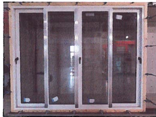
Photo de l'éprouvette

Cette éprouvette était composée par une fenêtre, en aluminium, avec quatre feuilles coulissantes et présentait les dimensions de 2880 mm x 2280 mm. Le verre utilisé a été un double vitrage type Incolore (5 mm) + Lame d'air (12 mm) + Incolore (6 mm)