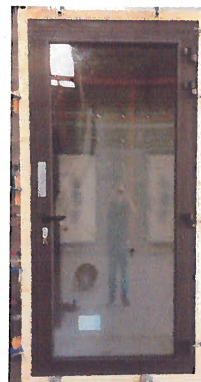
Fotografia(s) do provete

Este provete consistia numa porta em alumínio com corte térmico, composta por uma folha de batente com abertura para o interior, com as seguintes dimensões (LxH): 1075 mm x 2275 mm.